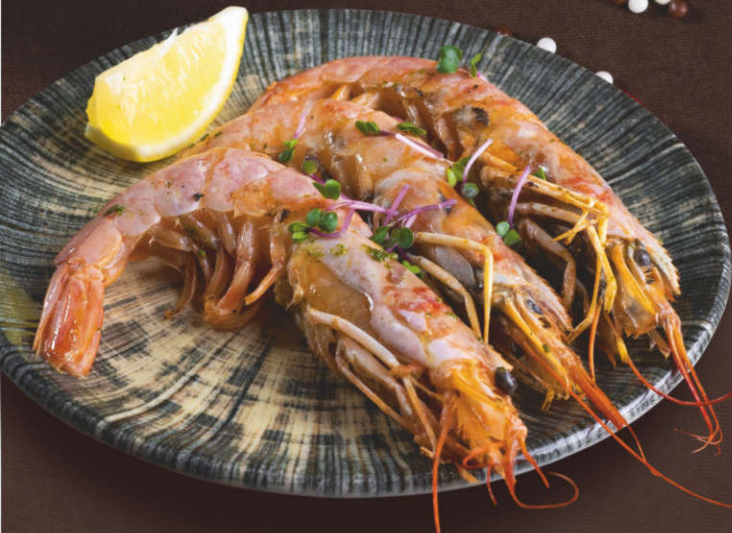
Лангустины, приготовленные на гриле с соусом «Песто» 180 гр.