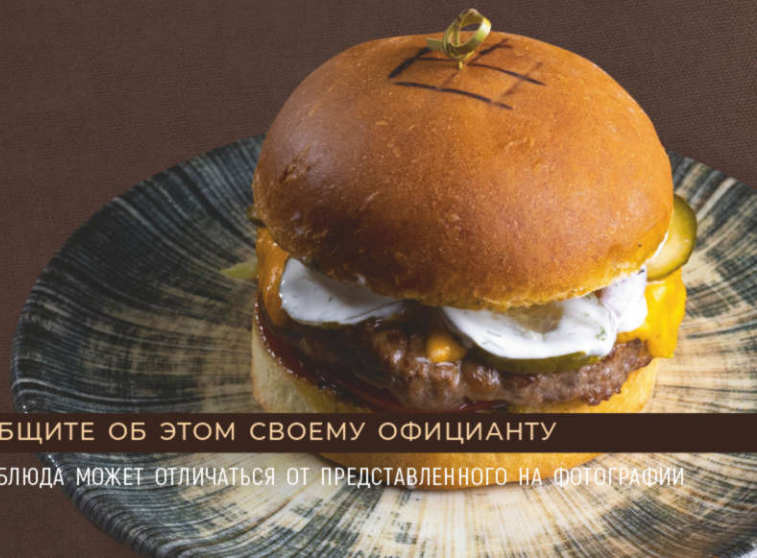
Чизбургер 330 гр. (Котлета из говядины и курицы, булочка пшеничная, салат листовой, томаты, лук красный, огурцы маринованные, сыр «Чеддер», соус BBQ, соус сметанно-горчичный)

ЕСЛИ У ВАС ЕСТЬ ПИЩЕВАЯ АЛЛЕРГИЯ - СООБЩИТЕ ОБ ЭТОМ СВОЕМУ ОФИЦИАНТУ