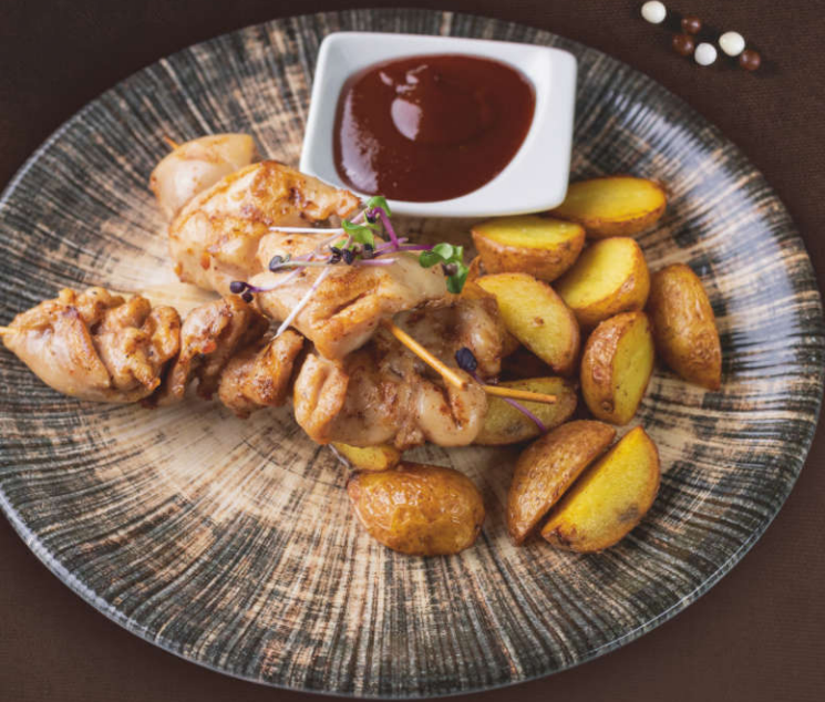
Шашлычок из курицы с жареным картофелем бэби и соусом BBQ 260 гр.