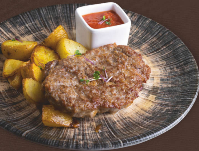
Стейк из свиной шейки, жаренный на гриле с картофелем бэби и соусом BBQ 275 гр.