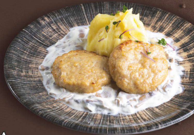
Куриные биточки с картофельным пюре и сливочно-грибным соусом 275 гр.