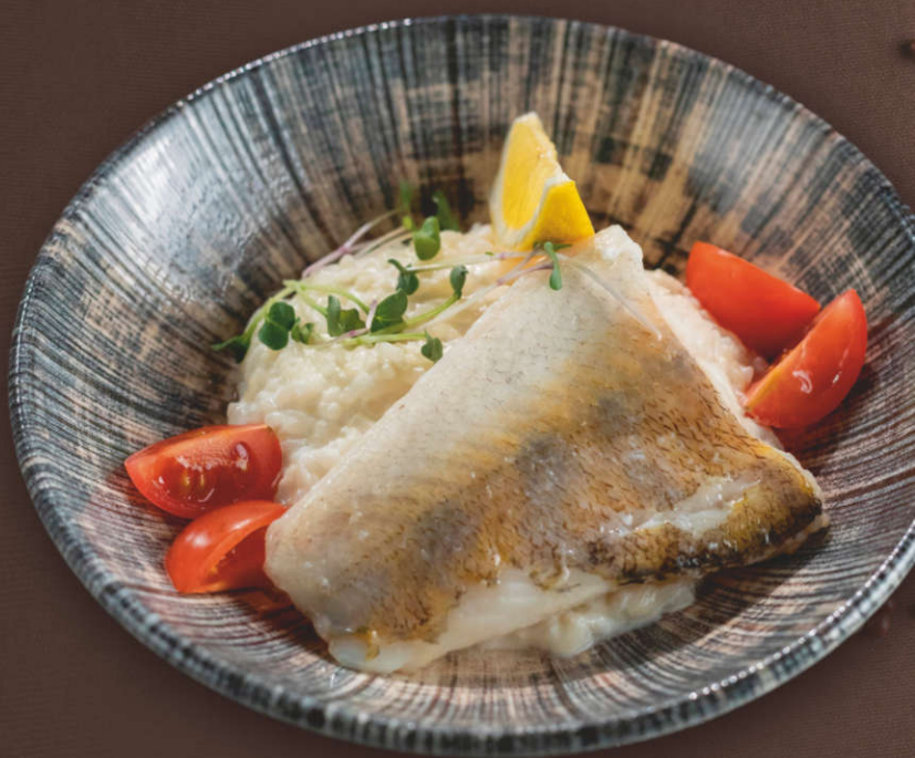
Форель радужная жаренная на гриле 1 шт. (Форель, лимон, соус «Песто»)