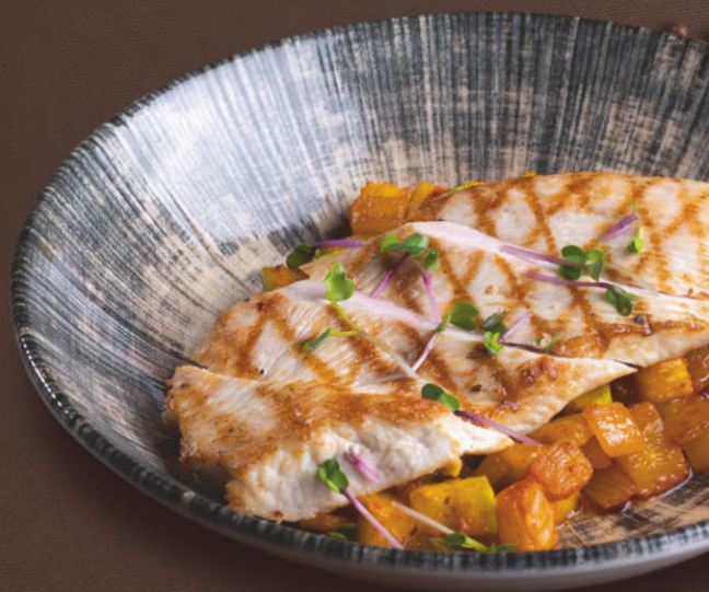
Курица с овощами и рисом 250 гр.

(Стейк из индейки, перец сладкий, кабачок, лук, соус томатный, вино белое)