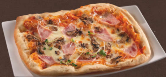
Пицца с ветчиной и грибами

340 гр. (Сыр «Моцарелла», колбаса «Пепперони», соус томатный)