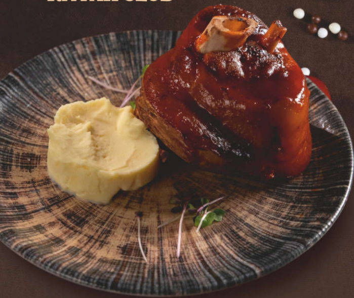
Свиная рулька, подается с картофельным пюре 1 шт. / 100 гр.