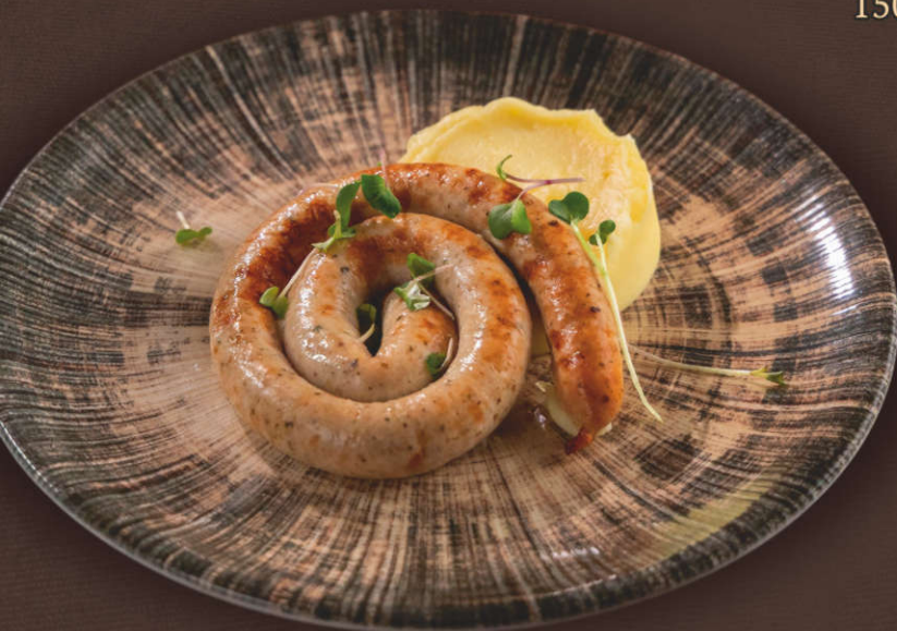
Колбаски куриные с картофельным пюре 230 гр.