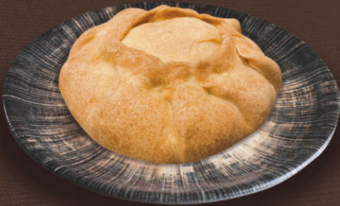
Элеш с курицей

(Тесто дрожжевое, говядина, картофель, лук)