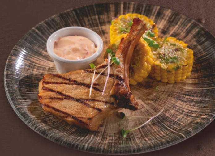
Свиная корейка на кости с кукурузой на гриле и соусом «Сливочный чили» 250 гр.