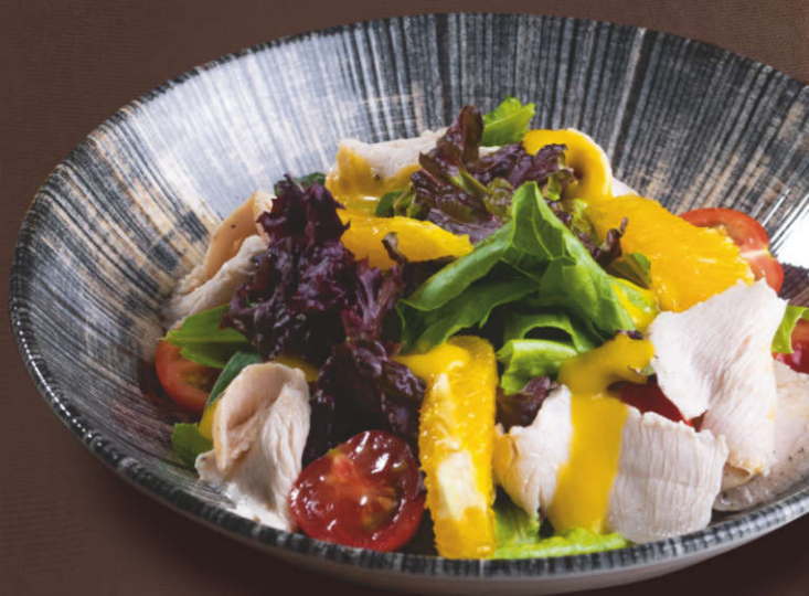
Салат с говядиной и горчично-медовым соусом 250 гр. [Стейк говяжий, микс салатов, томаты]