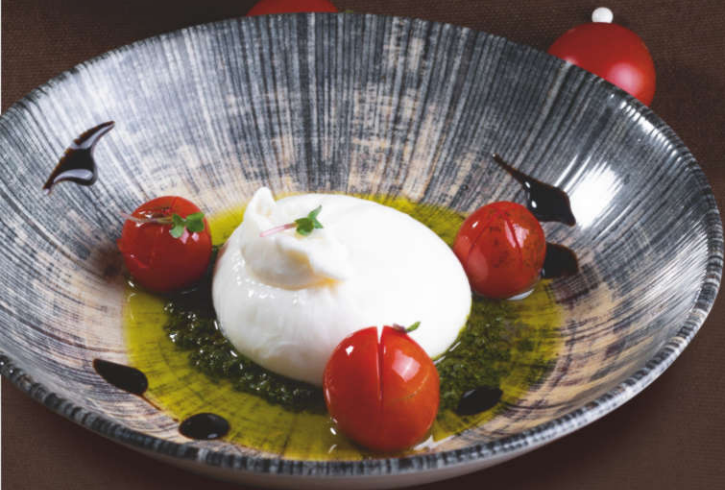
Буррата с печеными помидорками черри и соусом «Песто» 120 гр.