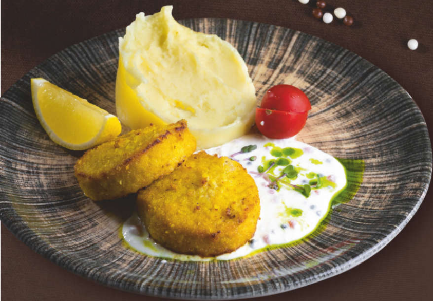
Биточки из щуки со сливочно- икорным соусом и картофельным пюре 260 гр.